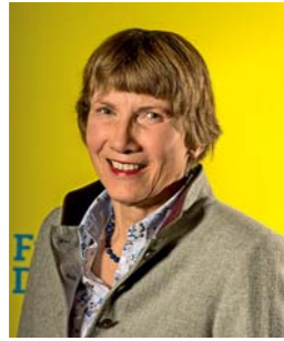
Dr. Christel Happach-Kasan Wahlkreis 2 RZ/Lauenburgische Seen